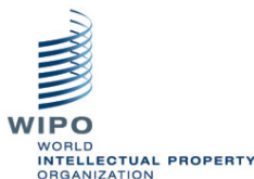
世界知识产权组织